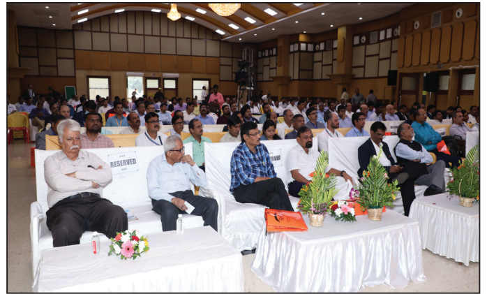
23rd Annual General Meeting held on Saturday the 12th November, 2022, Members attending the Meeting